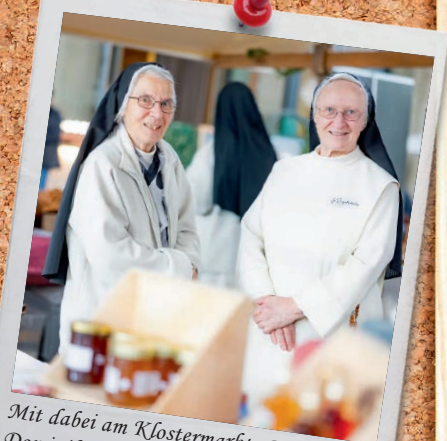
Mit dabei am Klostermarkt: Das Dominikanerinnenkloster Cazis

... am Wochenende vom 21./22. Juni in der Schweiz der Flüchtlingssonntag begangen wird? Zu diesem Anlass wird in Chur die Aktion «beim Namen nennen» organisiert. Über den Tag werden in Martinskirche Namen von Menschen verlesen, die ihr Leben auf der Flucht nach Europa verloren haben. Ihre Namen werden auf Zettel geschrieben, die vor der Kirche angebracht werden. Die Aktion endet am Sonntag, 22. Juni , mit einem ökumenischen Gottesdienst in der Martinskirche.