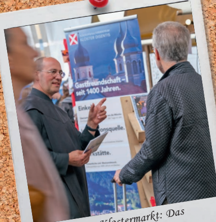
Mit dabei am Klostermarkt: Das Benediktinerkloster Disentis

... dass am 13./14. Juni 2025 in der Halle des Hauptbahnhofs Zürich zum dritten Mal der Klostermarkt Zürich stattfindet? Jeweils von 11 bis 19 Uhr. Über zwanzig Klöster und Ordensgemeinschaften bieten an 30 Ständen ihre Produkte an. Daneben gibt es kulturelle, künstlerische und handwerkliche Begleitveranstaltungen, eine kleine Gastronomie und eine kleine Kapelle mit Gebetszeiten. Mehr Infos: www.klostermarkt.org