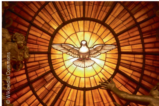
Raffigurazione dello Spirito Santo come colomba, Gian Lorenzo Bernini, vetrata, Cattedrale Petri, Basilica di San Pietro, Città del Vaticano (circa 1660).

La comunità cristiana non ha semplicemente copiato queste feste ebraiche, ma ha dato loro nuovi significati. Certamente la liberazione dall'Egitto e la consegna della legge sul Monte Sinai rimangono eventi impressionanti nella storia di Dio con l'umanità anche per noi cristiani. Ma per noi non sono più al centro della nostra fede. L'evento nuovo e formativo di identità per noi cristiani è ciò che è accaduto a Gesù Cristo, in particolare la sua risurrezione dai morti. Nella prima Pasqua, Dio ha salvato il popolo d'Israele dalla sottomissione al Faraone; la Pasqua cristiana ha aperto