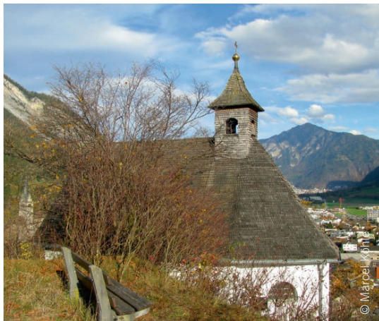
La caplutta da s. Antoni sin Tuma Castè a Domat.

En in da ses priedis ha el detg: «Il priedi ei mo effectivs sche las ovras plaidan.» – E quei ei remarcabel: in predicatur talentau dat dapli peisa allas ovras che a ses plaid! Forsa ei quei era in messadi impurtont per ozildi e per nossas Baselgias: mussei la cardientscha tras ovras (e buca mo tras gronds plaid)!