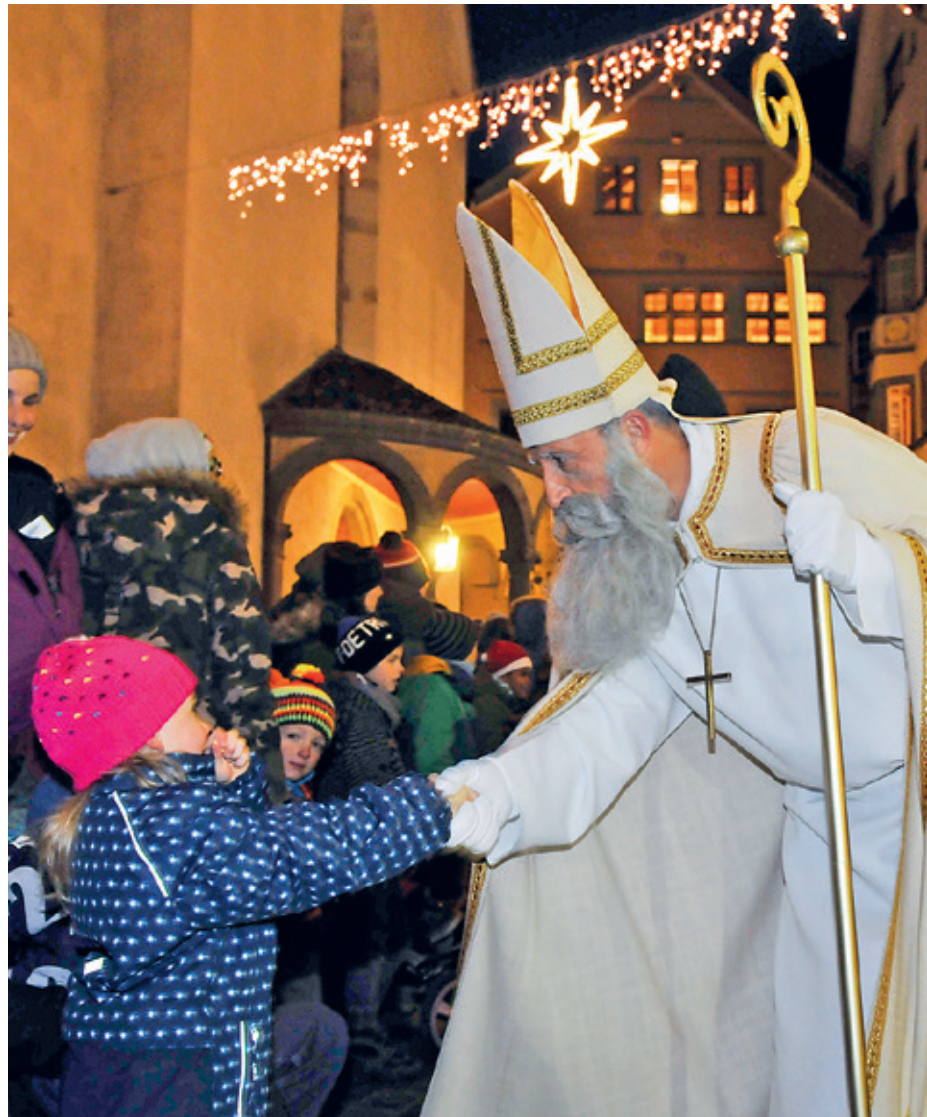
Der Nikolaus gibt einem Kind die Hand und zeigt ihm so, dass Gott alle Kinder liebt.