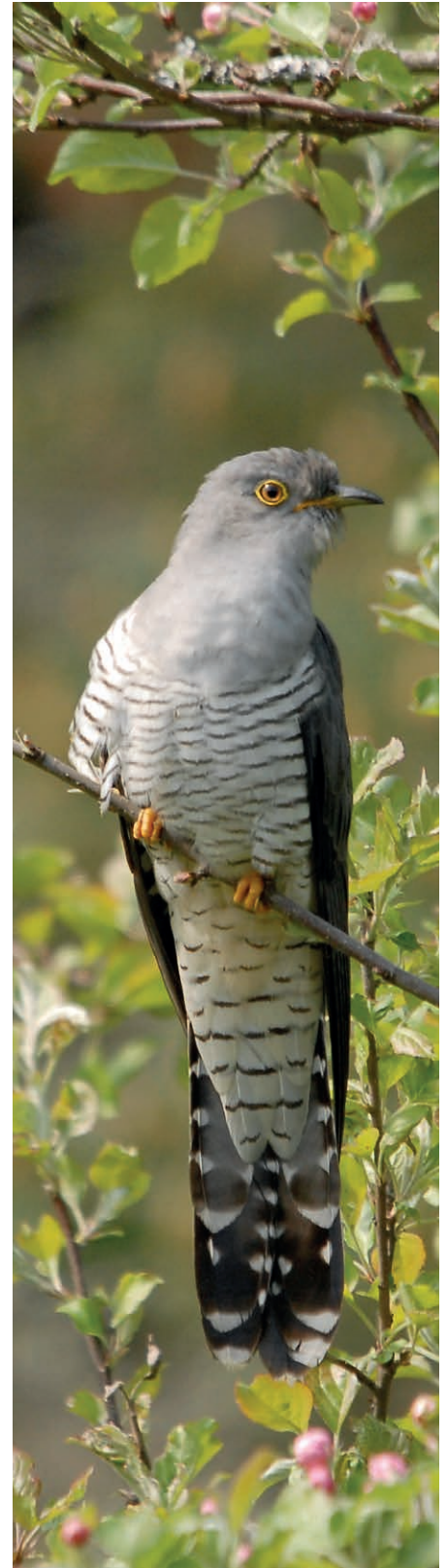
Sch’il cucu conta sin flurs tscherscher, dat ei paucas tschereschas, mo bia fein. Tgisà sche quei vala era per malers?

Temer ston ins denton buca ditg. Suenten mesastad semida il cucu en in sprer, ha ei num, ni en ina tschuetta. Quei ei forsa empau pli grev da verificar, mo tgisà. Tenor igl observatori d’utschals svizzer resta il cuculus canorus denton en Svizra tochen el fenadur ni egl uost. E lu ein ton il prighel sco era la caschun da profitar puspei pasai, silmeins per in onn.