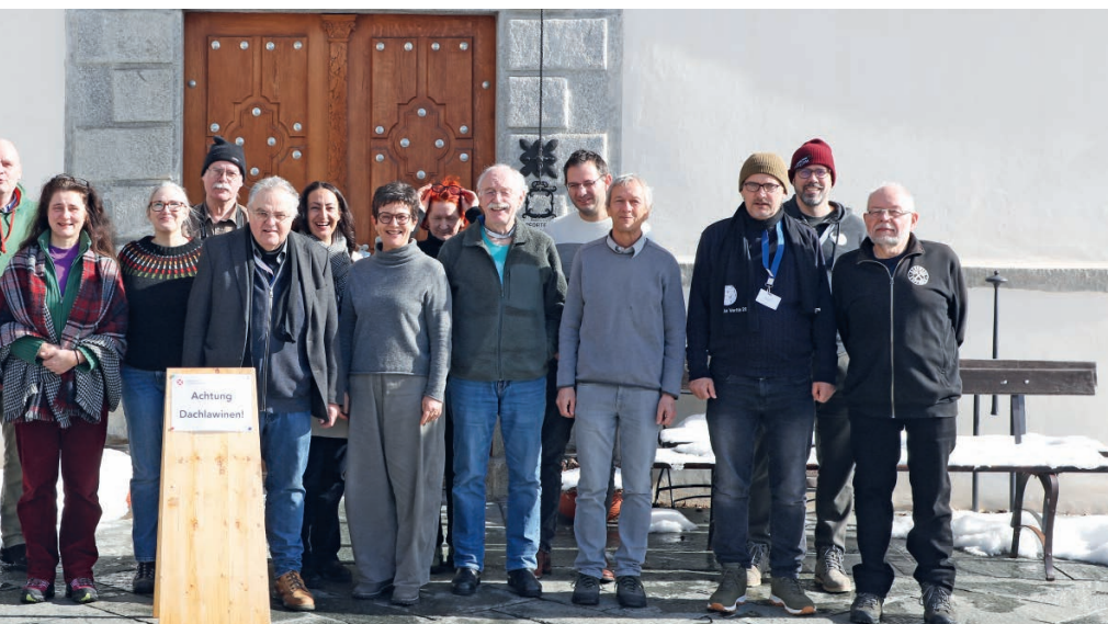
Die Workshop-Teilnehmerinnen und -Teilnehmer vor dem Kloster Disentis.