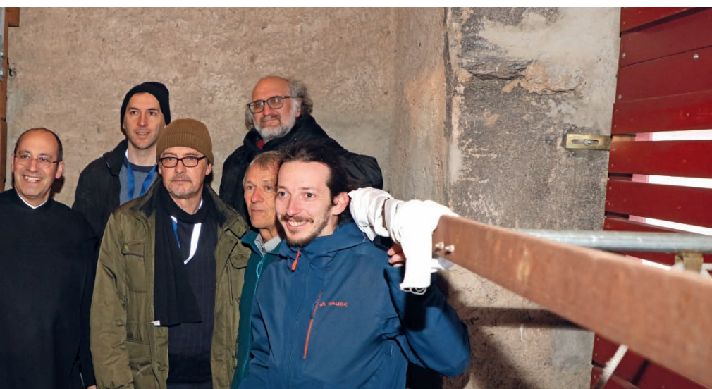
Besichtigung des Glockenstuhls des Klosters.