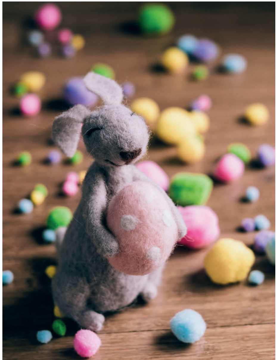
Der Osterhase ist seit alters her ein Symbol für Lebenskraft und Fruchtbarkeit.

Im neu verkündeten Christentum erkannten die Menschen Glaubenselemente ihrer vormaligen Religion. Sie behielten die