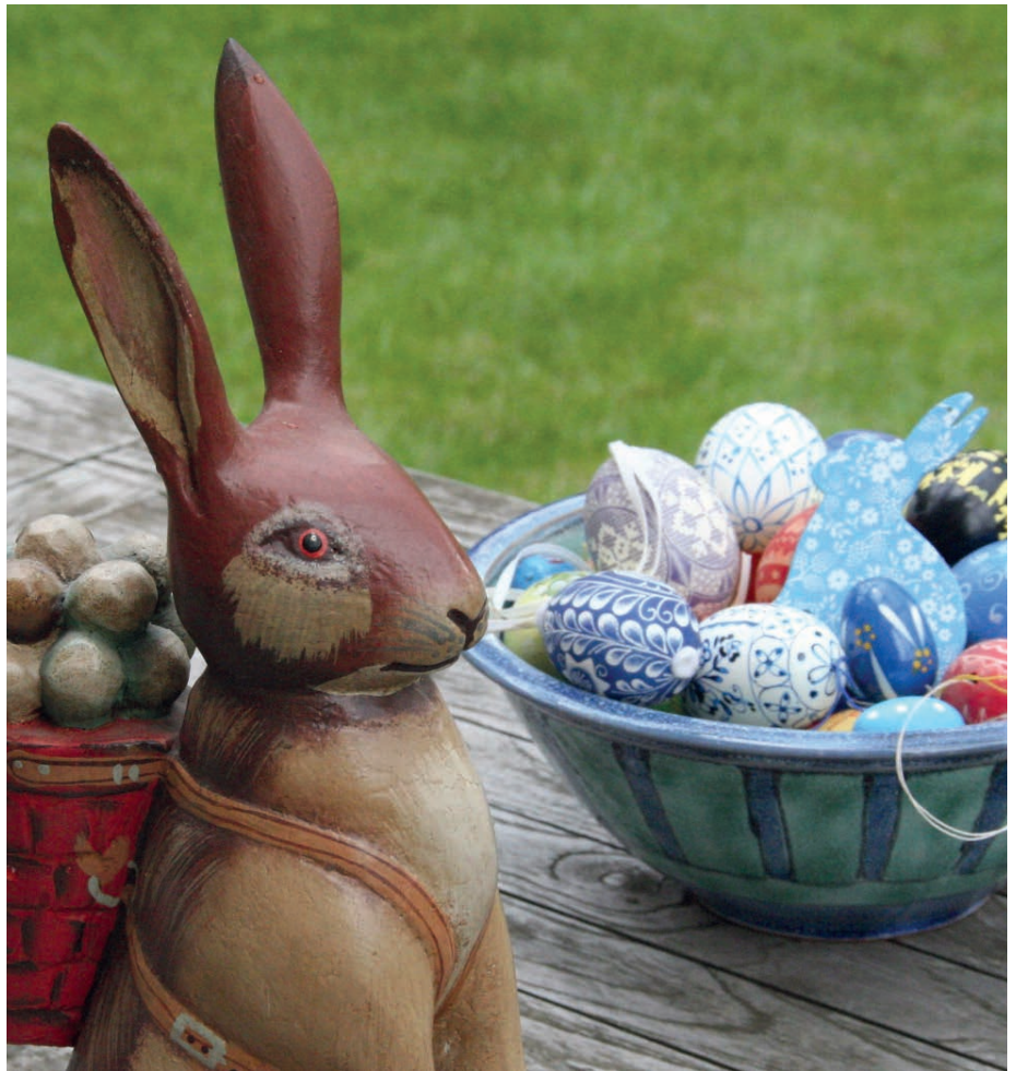
Als Eierbringer hat sich der Hase erst im 17. Jahrhundert etabliert.

Das Ei ist ein uraltes Symbol des Lebens.