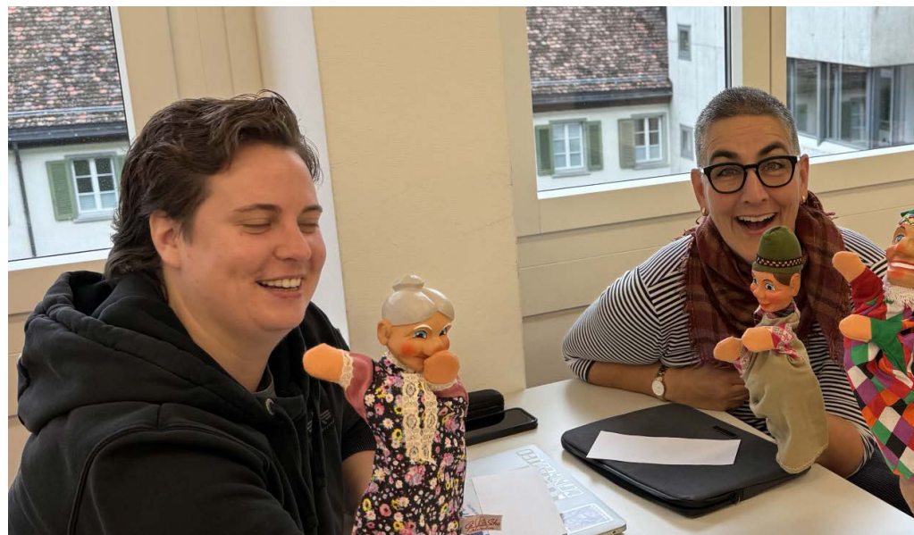
Die Seelsorgerinnen üben mit Handpuppen.