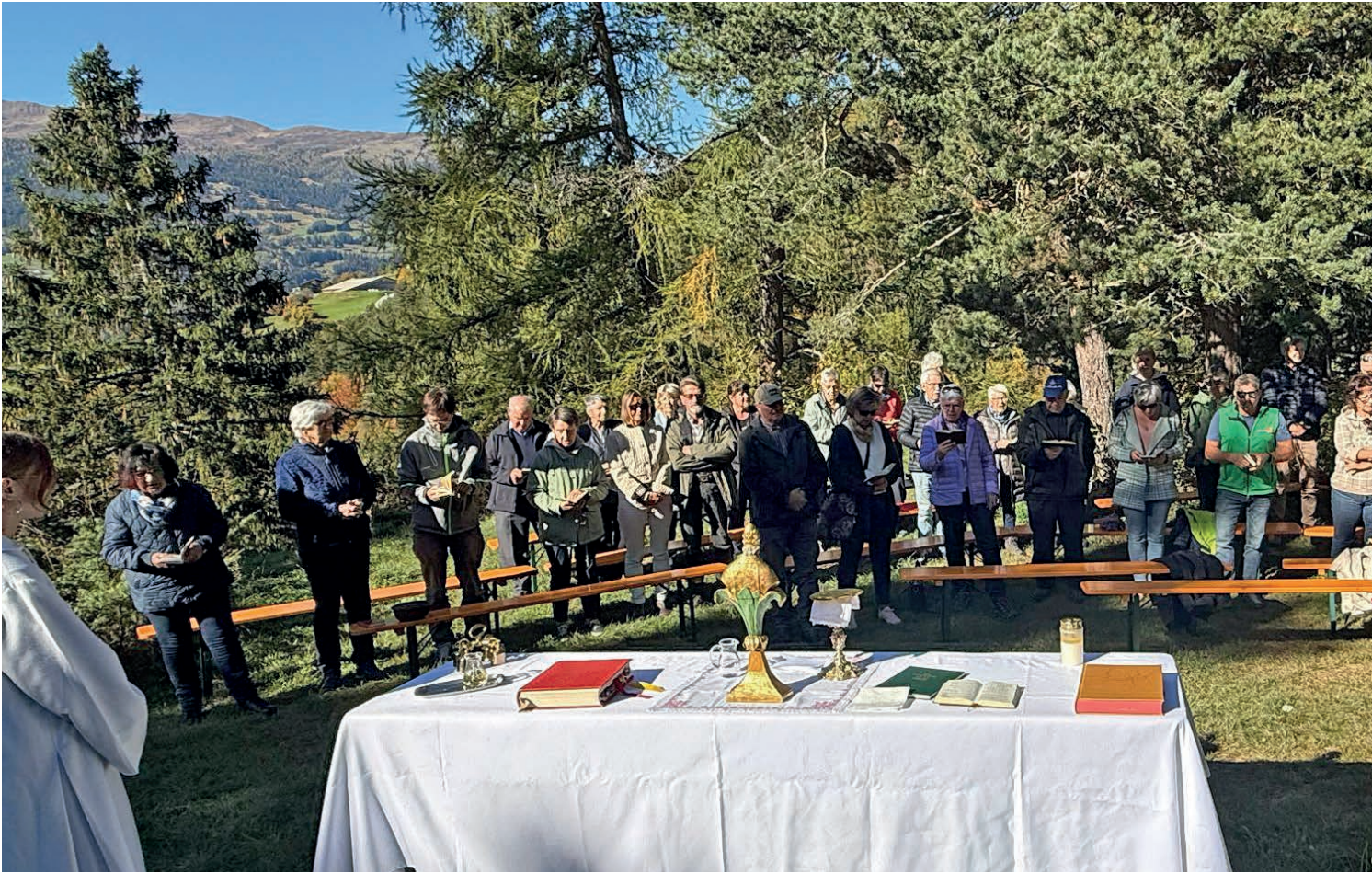
Messe mit den Einwohnerinnen und Einwohnern von Brienz/Brinzauls.

Ihre Zeit in der Kirchgemeinde Albula/Alvra war geprägt durch die zweimalige Evakuierung von Brienz/Brinzauls wegen des drohenden Bergsturzes. Wie stark hatte dies Einfluss auf Ihre seelsorgerische Arbeit?