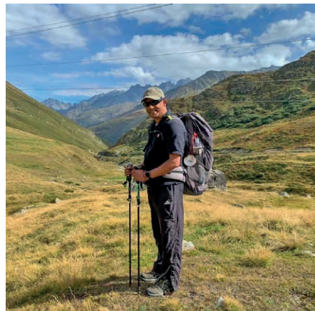
Jeu portel vinavon miu saccados cun in pign crap lien e sin via mettel mes quitaus els mauns da Diu.

Il crap ei in simbol per biaras caussas: cuolpa, tristezza, tema, fastedis, ni damondas senza risposta. Savens purtein nus quei en silenzi en nusez e sendisein vid la peisa. Nus vivin nossa veta, mo enzatgei mudregia nus vinavon. Sil Camino munta il deponer il crap in segn: Jeu confidel quei a Diu. Jeu retegnel buc tut per mei.