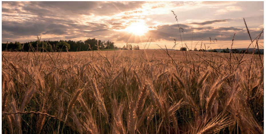
Pentecoste: dalla festa del raccolto al dono dello Spirito Santo.

Secondo il racconto degli Atti (2,1-13), i discepoli, colmati dallo Spirito, trovano una forza e una gioia tali da non poter più vivere come prima. Parlano con coraggio, superano le barriere linguistiche e culturali, e annunciano il messaggio di Gesù a tutti. Non tutti, però, capiscono ciò che sta accadendo: alcuni osservatori pensano che gli Apostoli siano fuori di sé. Ma per i discepoli quella è una trasformazione radicale. Chi era timoroso trova una nuova sicurezza; chi era incerto diventa capace di parlare